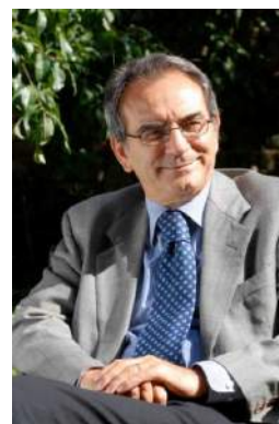
ROMANDO DEL NORD

Título de la presentación: “Tratamiento oncológico – Creación de espacios para potenciar la experiencia de los pacientes y los resultados para la salud”