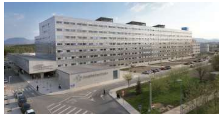
Hospital San Pedro de Logroño, España.