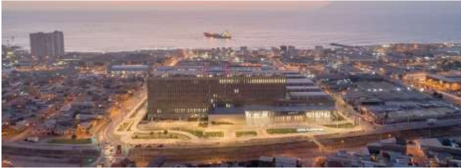
Hospital Regional Dr. Leonardo Guzmán, Chile.