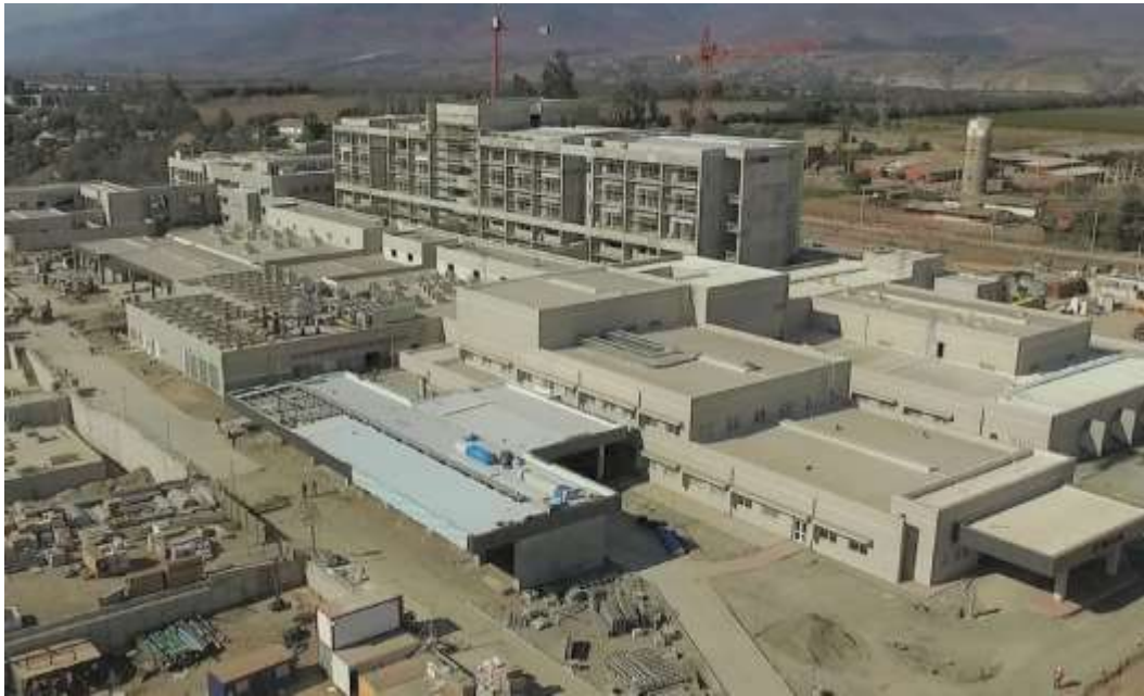
Nuevo Hospital de Ovalle

H+A / Hildebrandt + Asociados | Socio Honorario