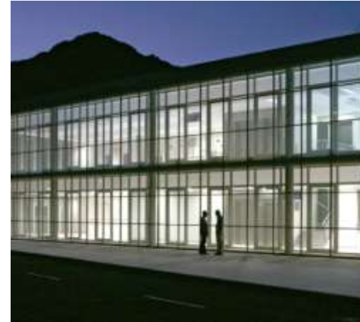
Hospital de la Gomera, España.