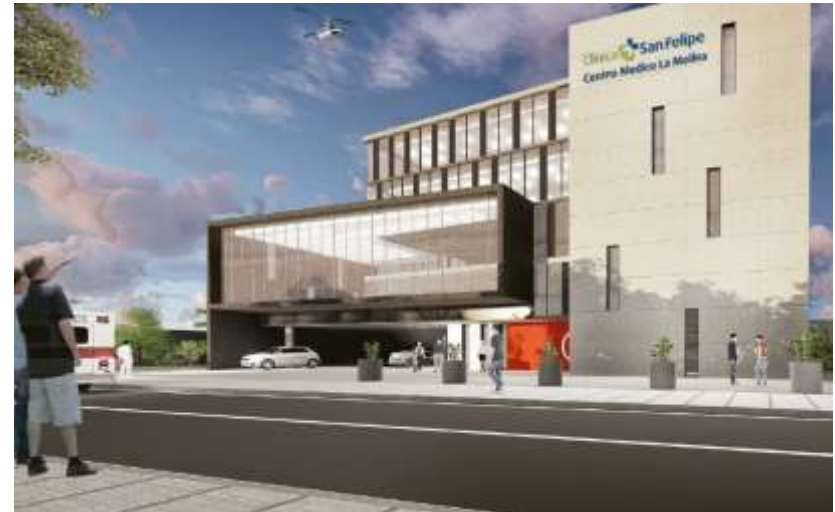
Centro Ambulatorio CSF / La Molina - Lima