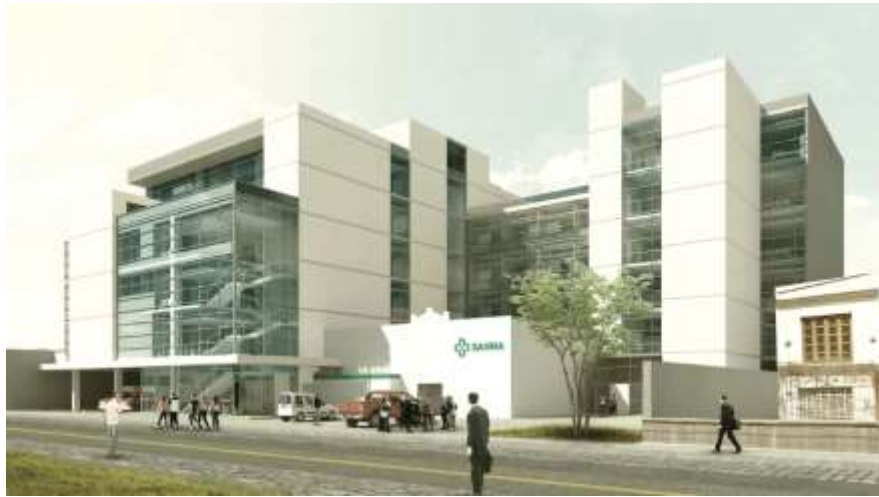
Clínica Sanna / Arequipa