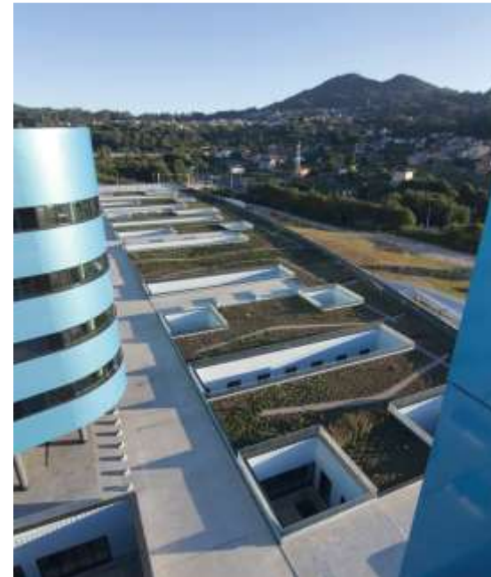
Nuevo Hospital de Vigo