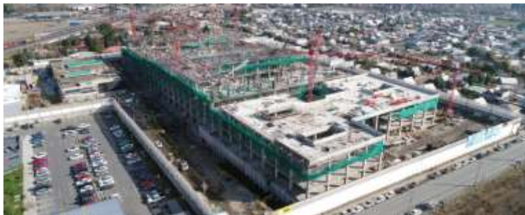
Hospital de Curicó, Chile.