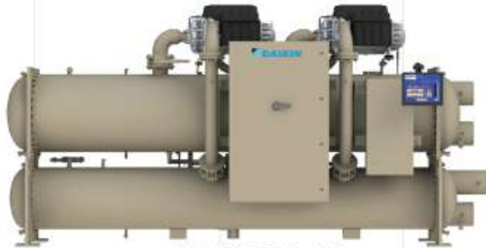
Model WMC 145-400D