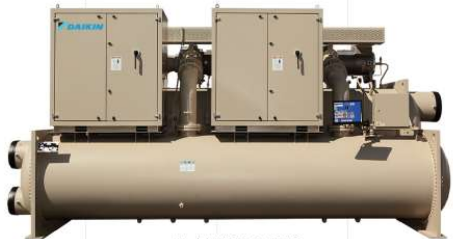
Model WME 1000-1500D