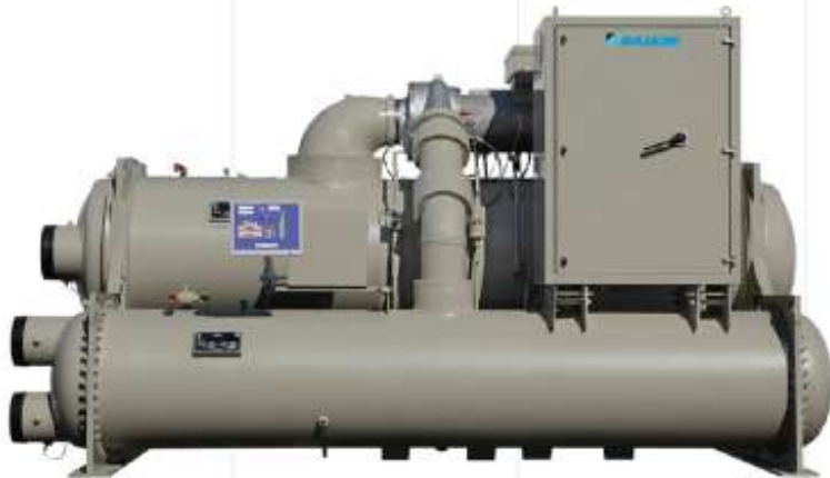
Model WME 500-700S